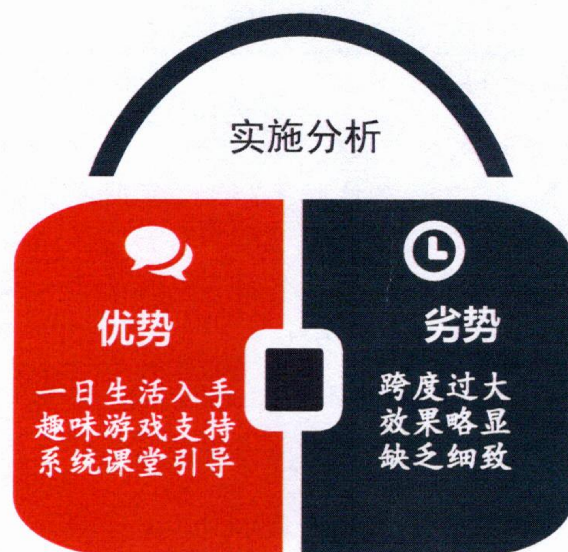
图 3：琪琪优势 VS 劣势分析表